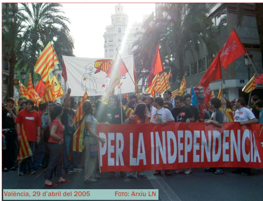
València, 29 d'abril del 2005

Cal emergir del marasme poruc i malaltís de la interminable «Transició» política espanyola i del seu discurs, captiu d'amenaça militar espanyola, que tantes renúncies innecessàries va comportar. De la mateixa manera que un grup de valencians ens ha volgut fer saber que la millor defensa del «valencià» és dir-ne català , hauríem de revisar totes i cadascuna de les nostres renúncies porugues de cada dia que ens impedeixen d'avançar com a poble català sobirà. I això, començant per la de no parlar en català als nous immigrants o als néts d'andalusos que senten catalans.◆